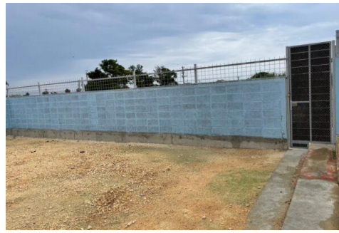
コンクリート部分の修繕、浸透柵の設置、ドッグランの整地