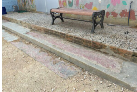
門扉設置、廃棄物置き場整備、軟水器設置

寄付を募って設置した左記の施設も3ヶ月後には撤去・軟水器は放置。 寄付をした皆さん、現状はこうなっていますよ。